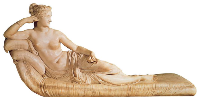
1. Iglesia de la Magdalena. 2. Columna de la Plaza Vendôme. 3. Puerta de Alcalá (Sabatini). 4. Museo del Prado (Villanueva). 5. Coronación de Napoleón (J.L. David). 6. Paulina Bonaparte (Antonio Canova).