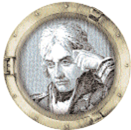
Almirante Horacio Nelson (1758-1805)

Muchos barcos rivales estaban en paralelo, lo que dificultaba sus disparos, y sufrían la llegada de la flota británica. El Barón de Collingwood, sustituto de Nelson tras su muerte, avanzó desde el Royal Sovereign hasta llegar a la popa del Santa Ana.