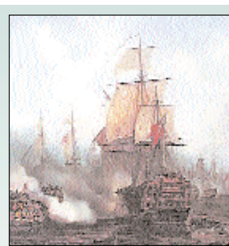
Ataque con cañones

En el momento del abordaje, los soldados de la infantería de marina luchaban con armas blancas y de fuego (sables, mosquetones...). Los cañones, preparados por seis personas, servían para disparar a poca distancia y lanzaban proyectiles de diferentes tipos.