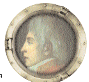
Cosme Damián Churruca