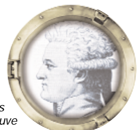
Pierre Charles Villeneuve

Villeneuve mandaba la flota combinada, Gravina era el responsable de los españoles y Churruca se hizo cargo del buque San Juan Nepomuceno.