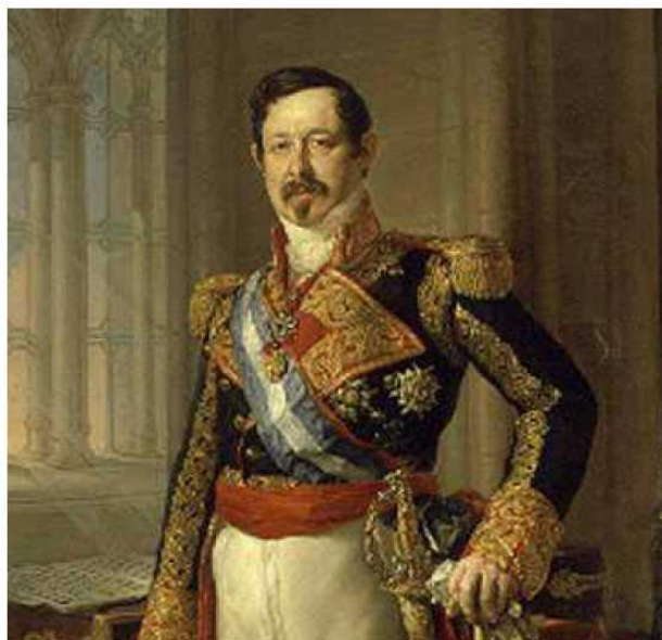
General Ramón María Narváez