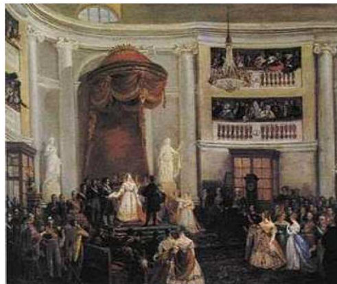
Jura de la Constitución de 1837