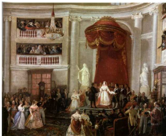
Isabel II jura la Constitución de 1837