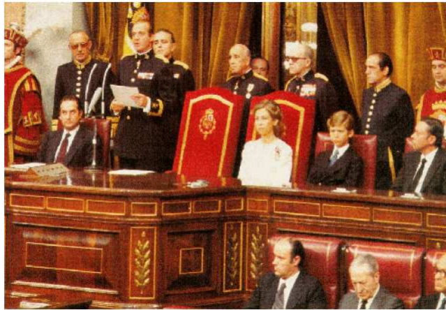
Apertura por Su Majestad Juan Carlos I de las Cortes Legislativas. Mayo de 1979