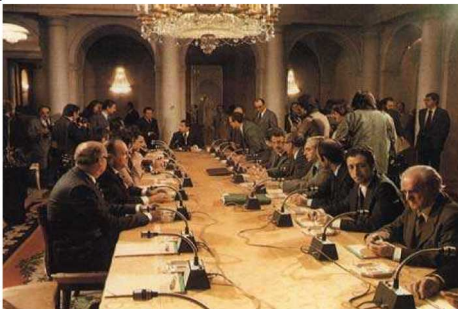
Firmantes de los Pactos de la Moncloa