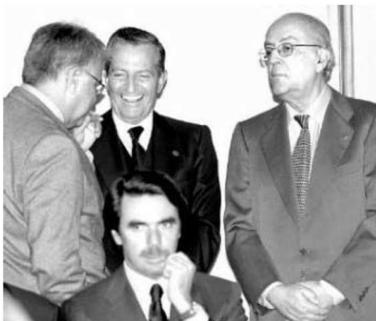
Presidentes del gobierno en la Monarquía de Juan Carlos