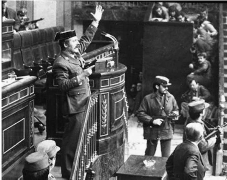
23 de febrero de 1981. Tejero en el Parlamento