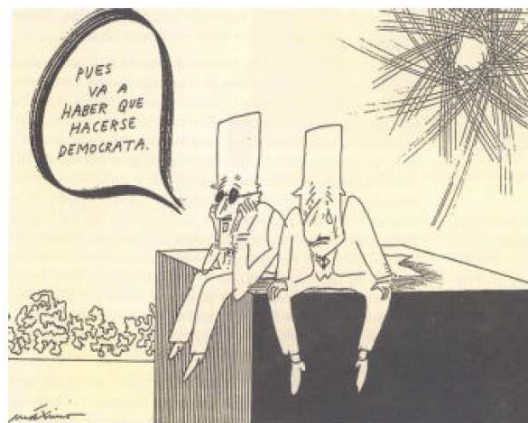
Chiste de Maximo aparecido en El País , febrero de 1976