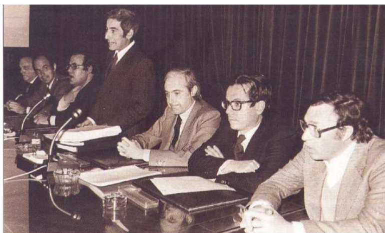
Comisión redactora del Proyecto de Constitución de 1978