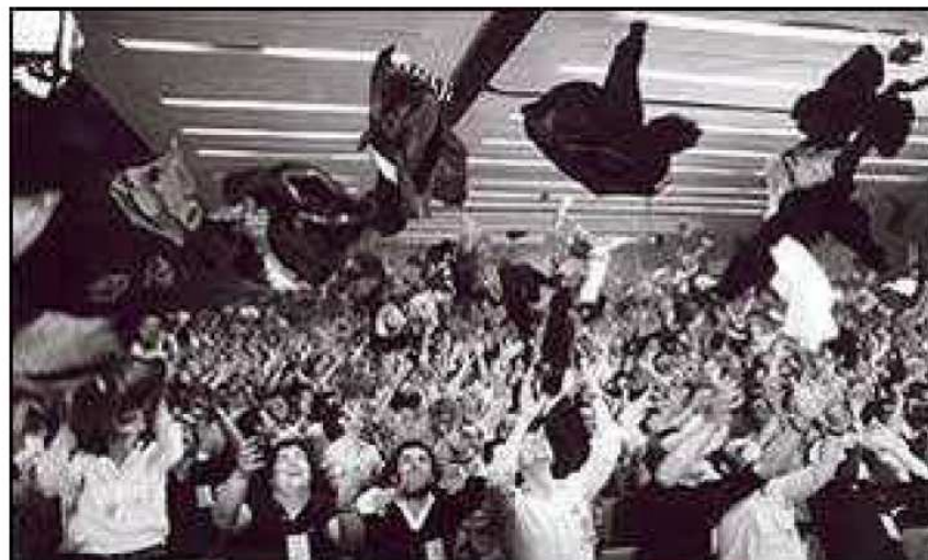
Los comunistas celebran la legalización de su partido en abril de 1977