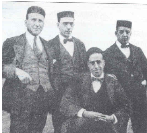
Julían Besteiro, Largo Caballero, Anguiano y Saborit: el comité de huelga del PSOE encarcelado tras los sucesos de agosto de 1917.

Realice una composición sobre España en el primer tercio del siglo XX: sociedad y economía. La crisis de 1917 , a partir del análisis del siguiente documento: