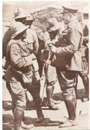
Primo de Rivera visita las tropas españolas en Marruecos.