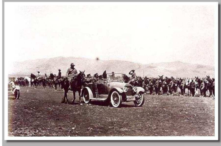
Parada militar con Primo de Rivera y Sanjurjo tras la victoria de Alhucemas en 1925.