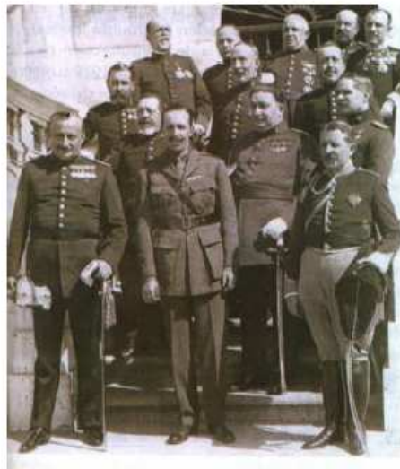
Alfonso XIII y el Directorio militar