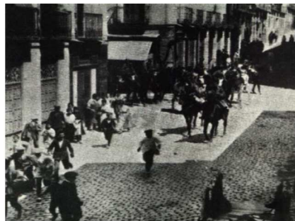
Huelga general de agosto de 1917.

Realice una composición sobre España en el primer tercio del siglo XX: sociedad y economía. La crisis de 1917 , a partir del análisis del siguiente documento: