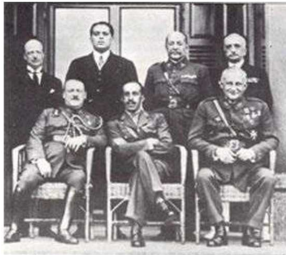
Miguel Primo de Rivera (sentado a la derecha) al frente del directorio civil en 1925 a su lado el rey Alfonso XIII