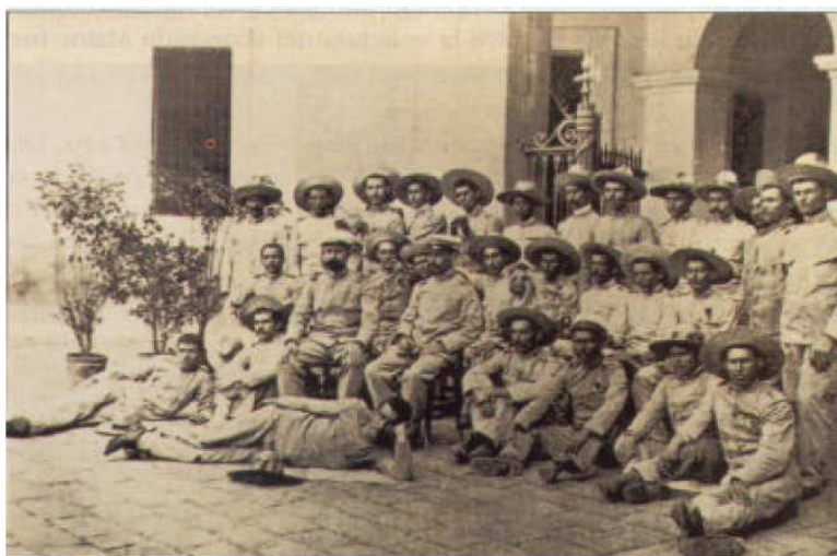
Los últimos de Filipinas: La guarnición española de Baler se rindió a los independentistas el 2 de junio de 1899, después de 337 días de asedio. La guerra había terminado mucho antes.