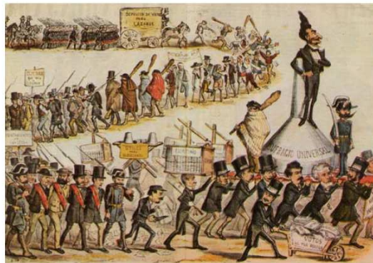
Sagasta es paseado en triunfo sobre un embudo y va seguido de una procesión en la que desfilan todos los vicios electorales de la época. Caricatura de “La Carcajada”.