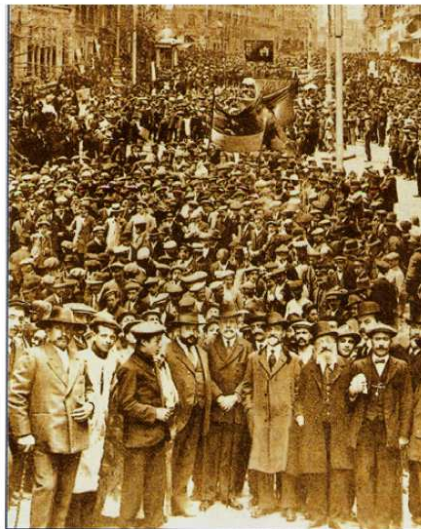
Pablo Iglesias, fundador del PSOE, en una manifestación de trabajadores en Madrid, con motivo del Primero de Mayo.