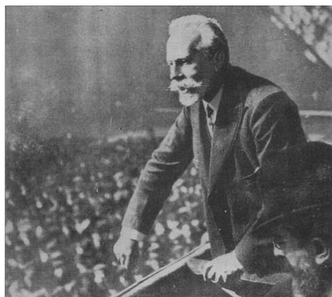
Intervención de Pablo Iglesias en un mitin