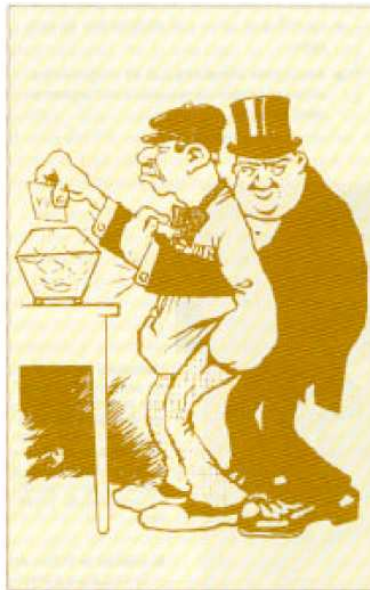
Caricatura publicada en la revista "L'Esquella de la Torratxa".