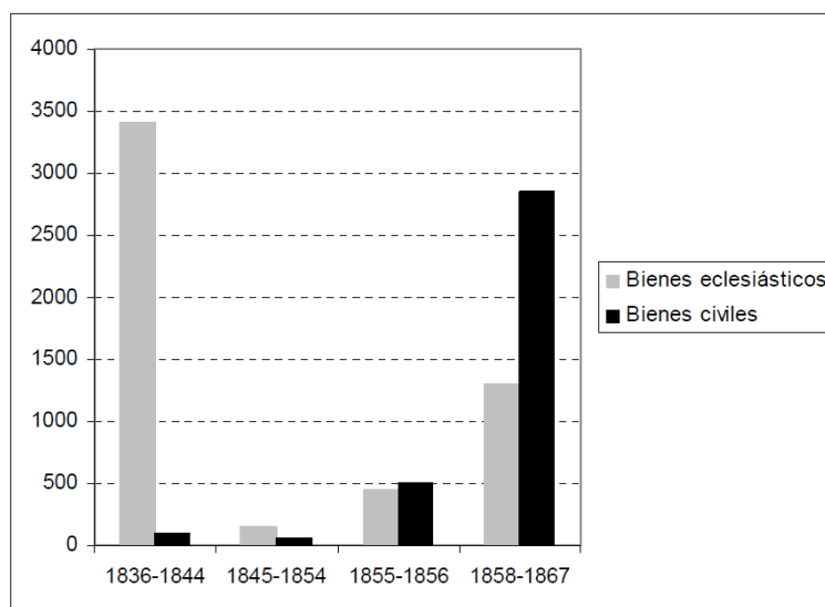
Desamortización eclesiástica y civil (en millones de reales de vellón)